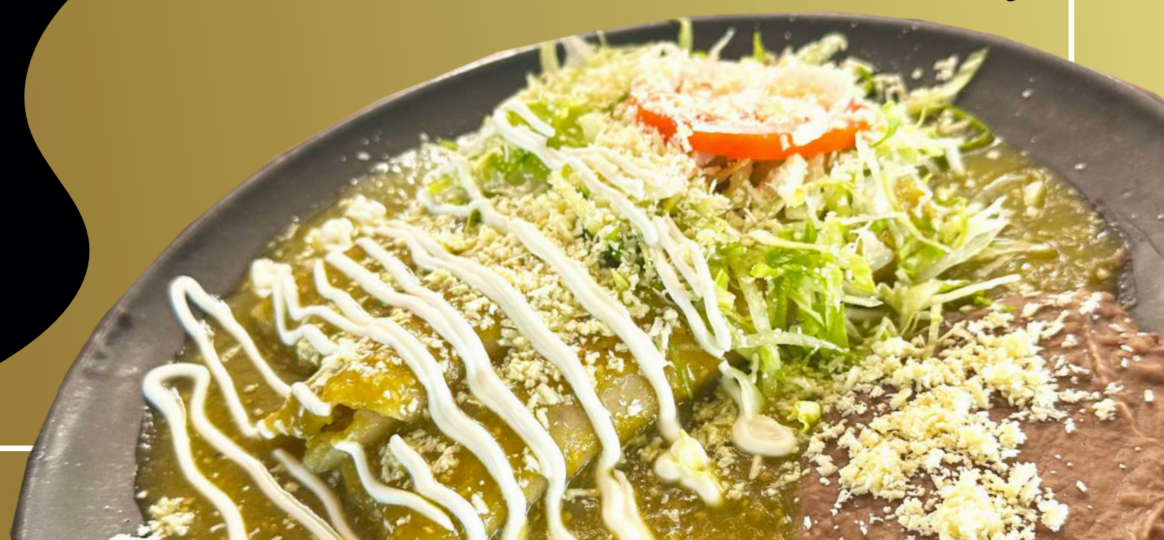
Enchiladas verdes de pollo